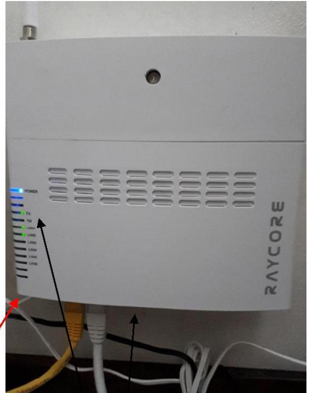
1 ODB 2 CPE Switch

ODB(1) med fiber ansluten till CPE(2) Både Power/FX skall lysa om det är OK.